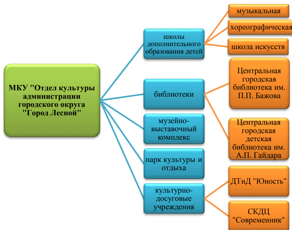
Рис. 3 Структура учреждений культуры городского округа «Город Лесной»

С 1962 года в городском округе работает своя студия телевидения, с 1950-х годов существует свое радио. В структуре МКУ «Отдел культуры» работают 9 учреждений культуры