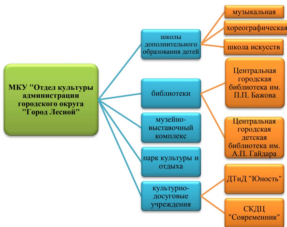
Рис. 3 Структура учреждений культуры городского округа «Город Лесной»

В структуре МКУ «Отдел культуры» работают 9 учреждений культуры.